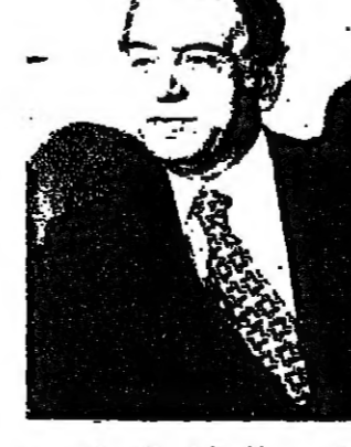
محللته مع المستشار النمساوي برونو كرايسكي . ومن ناحية اخرى لا يزال الاشراب الذي اعلمه فقير مطار بيروت الدولي مستورا اليوم الثاني على التوالي في البنية على م ٦٤٨

طوكيو - اجتمع الرئيس الاميركي جيمي كارتر امس برئيس الحكومة الصينية السيد هواو كونغ . وقال السيد جودي ياول الناطق بلسان البيت الابيض اميركي ان الزعيمين بحثا خلال الاجتماع الذي استغرق نحو ساعة وثلاث الساعات للتدخل السوفياتي في افغانستان وسيطرة جنود فيتناميين على كمبوديا بدعم سوفييتي . وأضاف ان الرئيس كارتر والسيد كونغ قد اتفقا على ضرورة تبادل الزيارات بينهما . وكان الرئيس كارتر قد مرح قسبل اجتماعه بالزعيم الصيني بانه ينبغي على الولايات المتحدة والصين واليابان التعاون نيبا بينهما لمواجهة النظام العسكري السوفياتي ، الا انه رفض فكرة اقامة خلف رسمي موجه ضد الاتحاد السوفياتي